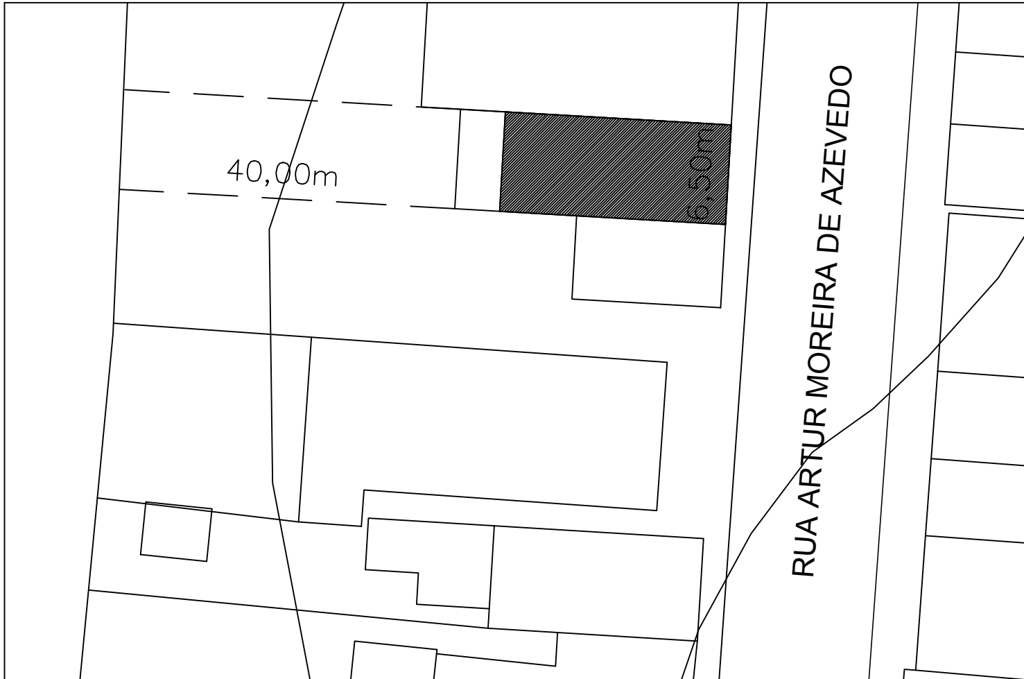
1 PLANTA DE SITUAÇÃO ESCALA _____ 1:250