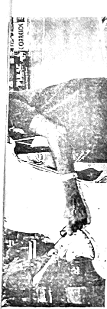
SHOW DO FAGNER A cada dia melhor e cada dia mais emoção. Figura mais uma vez nesta coluna que só mostra vitoriosos.