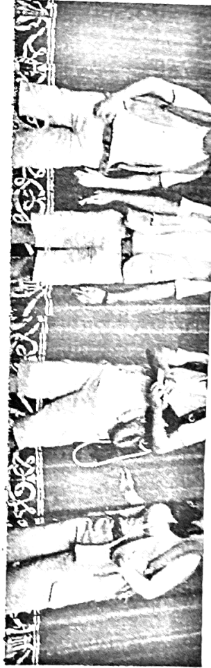
11h e das 14h às 16h, via plataforma Google Meet, também por meio de transmissões on-line. Webinário sobre arte-educação - 31 de Agosto, das 9h às 11h, no Canal do Teatro José de Alencar no YouTube. Visita Espetacular - uma aventura no Teatro José de Alencar - edição on-line Dias 12, 17, 18, 19, 20, 24, 25 e 26 de Agosto, com sessões manhã e tarde, sempre às 9h e às 14h.

Estado do Ceará - Prefeitura Municipal de Milhã - Aviso de Licitação - Pregão Eletrônico nº 1108.01/21-PE. A Prefeitura Municipal de Milhã/CE, torna público que a partir do dia 19 de agosto de 2021 às 09h00min estará disponível o cadastramento das propostas de preços no site: www.bll.org.br, referentes ao Pregão Eletrônico nº 1108.01/21-PE, cujo objeto é a contratação de serviços de locação de veículos tipo Ônibus, micro-ônibus, carro de passeio, por quilômetro rodado, com motorista, combustível, manutenção corretiva e preventiva por conta da contratada, para atender as necessidades do transporte escolar dos alunos matriculados na Rede de Ensino do Município de Milhã/CE. Início da sessão de disputa de lances: dia 31 de agosto de 2021 às 09h00min (horário de Brasília - DF). Referência edital poderá ser adquirido nos sites: www.bll.org.br ou www.foa.ca.gov.br/licitaçoes ou ainda no horário de 08h00min às 14h00min na Sala da Comissão de Licitação, situada na Rua Pedro José de Oliveira, Nº 406, Centro, Milhã - Ceará, 19 de agosto de 2021. Carlos André Figueiró - Pregoeiro.