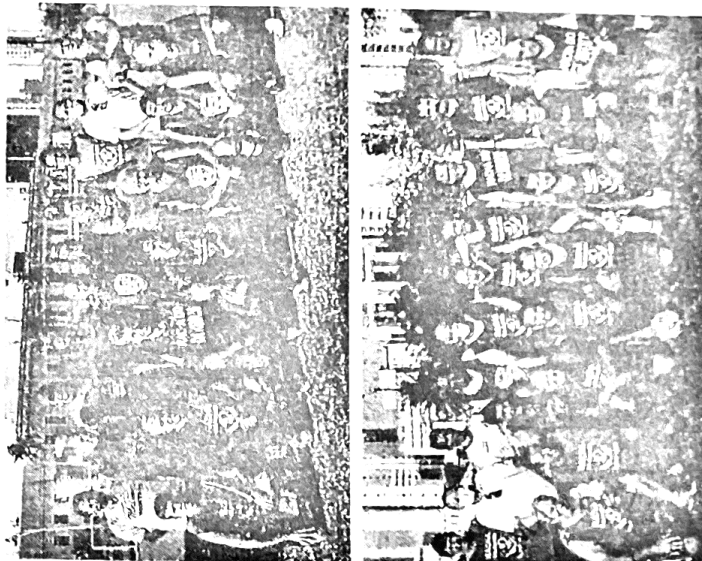
PELADÃO O Estádio Eudoro Correia, que pertencia ao Colégio Militar, foi pouco na década de 70 do maior torneio de futebol amador de nosso estado. O peladão 70, reuniu 40 times