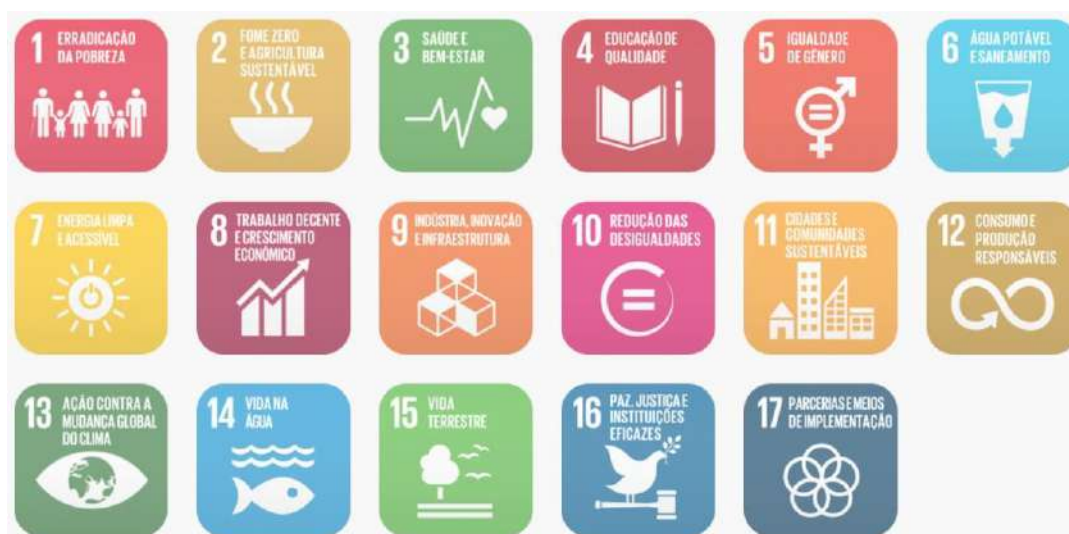
Figura 02: Objetivos de Desenvolvimento Sustentável

Em fortalecimento aos compromissos firmados pelo governo federal junto a ONU que fazem parte dos Objetivos de Desenvolvimento Sustentável – ODS, articulados através da agenda 2030, este projeto promove a utilização de estratégias para construção de edificações sustentáveis, como forma de garantir a sua resiliência e adaptabilidade em meio às mudanças climáticas. Sendo assim o mesmo foi desenvolvido com a utilização de sistemas construtivos capazes de contribuir para a preservação e conservação do meio ambiente, diminuindo o uso e o esgotamento dos recursos naturais, a produção de resíduos e o consumo de energia.